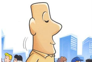
Ilustração de Maurício de Sousa para o livro O maior anão do mundo